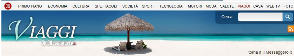
Immagine 10 di 10