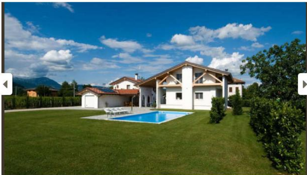
Immagine 5 di 10

Dal Lazio al Veneto, il tour delle "Cantine aperte a S. Martino"