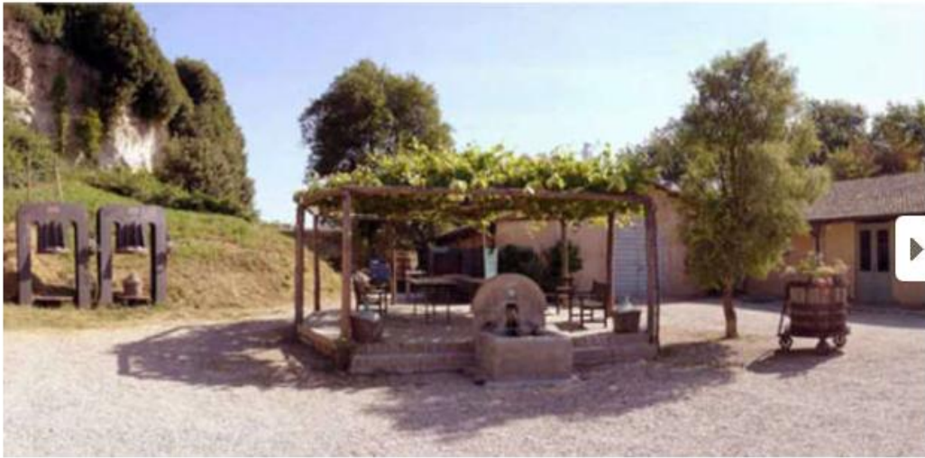
Immagine 1 di 10

Dal Lazio al Veneto, il tour delle "Cantine aperte a S. Martino"