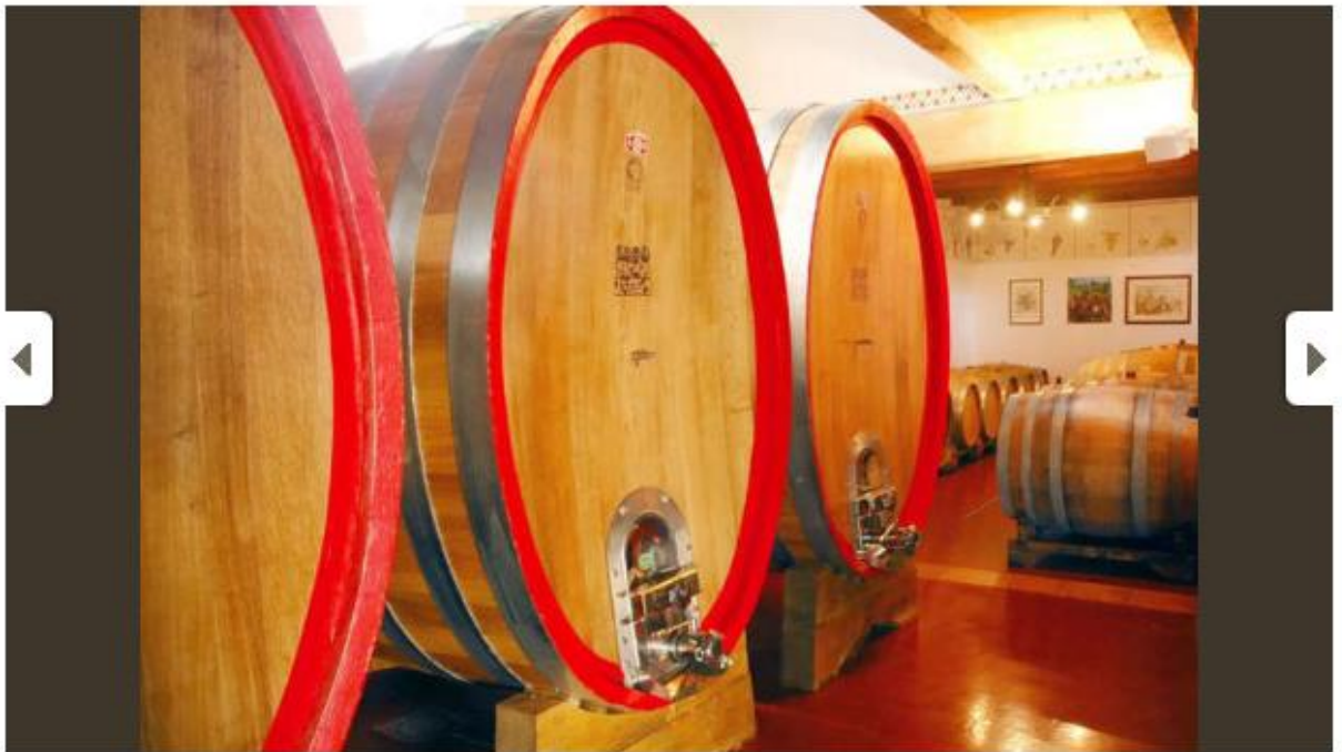
Immagine 9 di 10

Dal Lazio al Veneto, il tour delle "Cantine aperte a S. Martino"