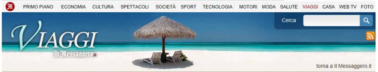
Immagine 3 di 10