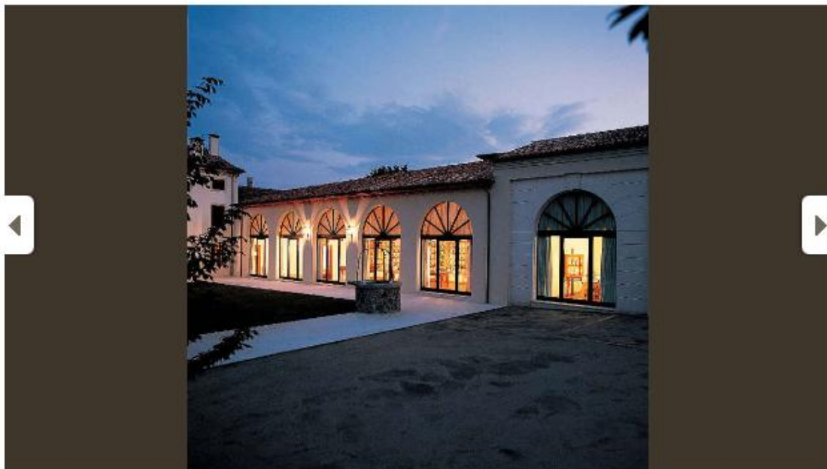
Immagine 6 di 10

Dal Lazio al Veneto, il tour delle "Cantine aperte a S. Martino"