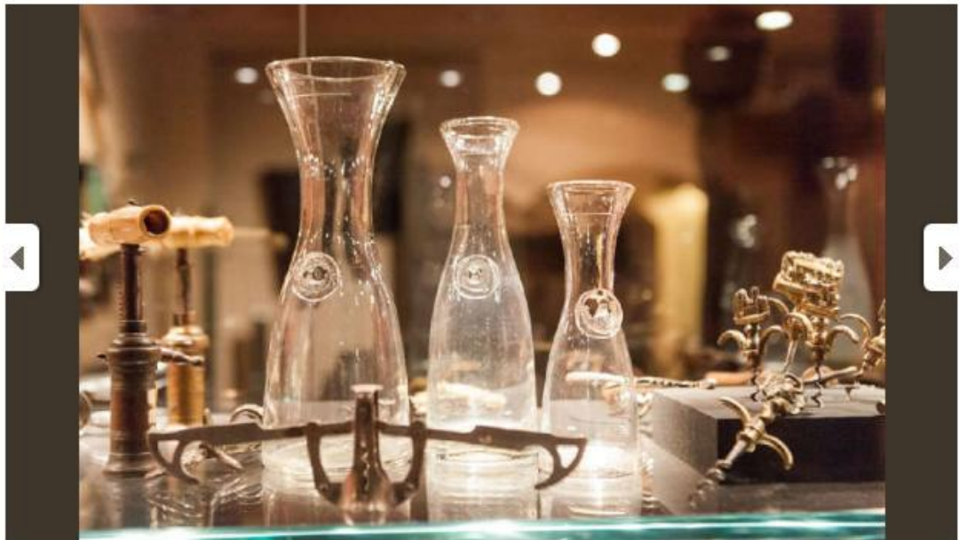
Immagine 2 di 10

Dal Lazio al Veneto, il tour delle "Cantine aperte a S. Martino"