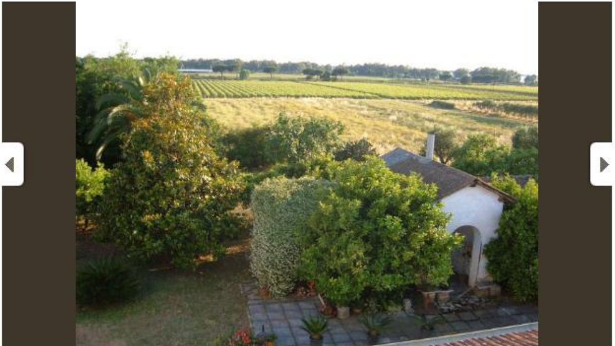
Immagine 8 di 10

Dal Lazio al Veneto, il tour delle "Cantine aperte a S. Martino"